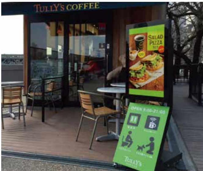
タリーズコーヒージャパン様 設置事例